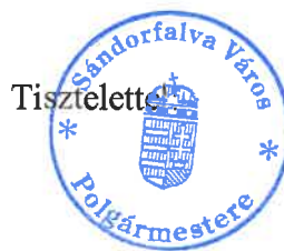
Gajdosné Pataki Zsuzsanna polgármester