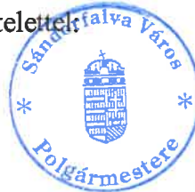
Gajdosné Pataki Zsuzsanna polgármester