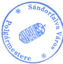
Gajdosné Pataki Zsuzsanna polgármester