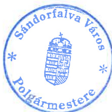
Gajdosné Pataki Zsuzsanna polgármester