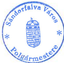
Gajdosné Pataki Zsuzsanna polgármester